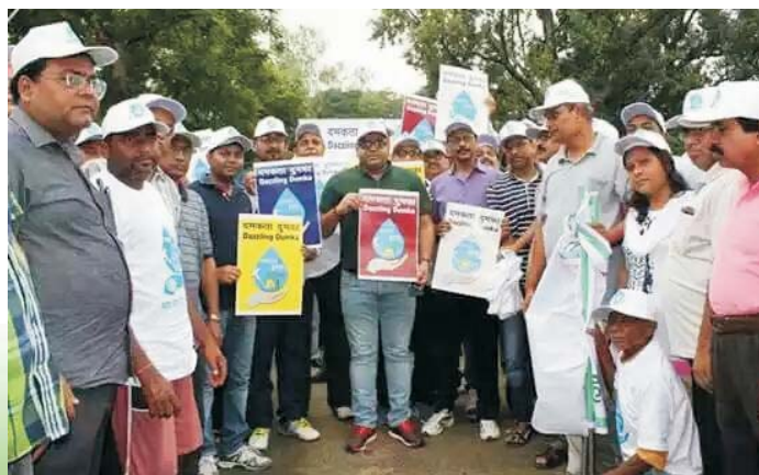
Hon'ble VC, SKMU with DC, DDC and other Officers of Dumka launching 'Damakta Dumka' campaign

Though there are professional sweepers to clean the toilets and basins, the students play an active role in checking that these facilities are kept clean and if necessary do the cleaning themselves. Faculty members regularly motivate their students to develop hygienic habits and thereby reduce the possibility of an unclean surrounding.