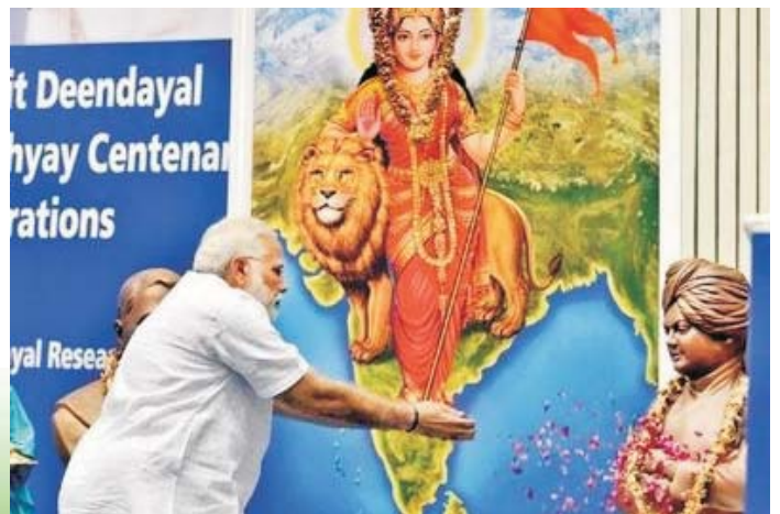
Prime Minister offering tribute to Swami Vivekanand on 11.09.2017 in Vigyan Bhawan, New Delhi - Live telecast in SKMU Campus

On 11 September 2017, the University and all its affiliated colleges, commemorated the 125 th anniversary of Swami Vivekananda's famous Chicago Address at the World Parliament of Religions. Two sessions were organized in the Conference Hall of the University to mark the occasion. In the first session the faculty and students assembled to watch the live telecast of Prime Minister's speech on the