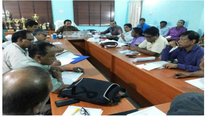
Vice Chancellor addressing the HODs on 'Swachhata hi Seva' Abhiyan on Campus development

have been planted in the university campus. Visitors to the university, special guests like state officials and other dignitaries have participated in the planting of trees. In the last months when two cabinet ministers of the Jharkhand government visited the University, they had participated in planting over 500 Arjun trees on which silk worms thrive; this was done also keeping in mind the MoU that the University has with Central Silk Board.