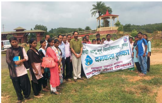
Hon'ble VC with the students and teachers starting 'Damakta Dumka' campaign from the campus