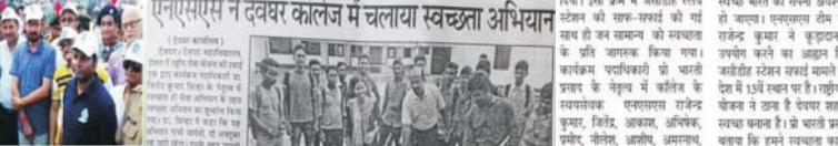
'स्वच्छता ही सेवा' कार्यक्रम में शामिल हो