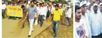
'स्वच्छता ही सेवा' कार्यक्रम में शामिल हो