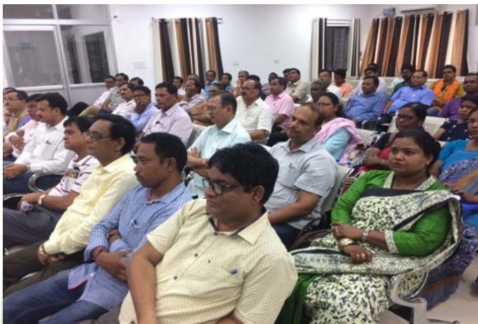
A view of audience listening to the Prime Minister in SKMU Campus

significance of Vivekananda's address. This was also telecast in parallel sessions at all the constituent and