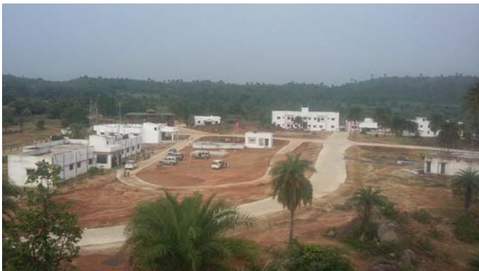
Green and clean University campus going to be smart one