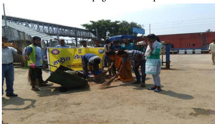
'Swachhata hi Seva' at Railway Station

to make it a success. The team lead by the Vice-Chancellor comprised several important citizens of the town, visited the busiest places of the town. Students of the university organized and participated in quite a few street-plays on the theme of the importance of cleanliness to raise awareness among the people. Inspired by the Vice-Chancellor, the Principals of the various affiliated colleges have also taken similar initiative.