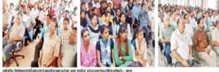
स्वामी विवेकानंद के शिक्षाओं को 12वीं वर्ष पर विद्यार्थियों ने आत्मसात करने का आयोजन

दुमका, 12 अक्टूबर: एनडीए के मंत्री एन.टी. रामा राव ने कहा कि विवेकानंद के आदर्शों को आत्मसात करें युव।