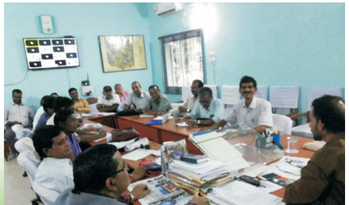
Hon'ble Vice Chancellor SKMU addressing the HODs regarding NAAC preparation and backlog clearance