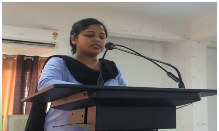
Participation by student in Symposium on Swami Vivekananda

significance of Vivekananda's address. This was also telecast in parallel sessions at all the constituent and