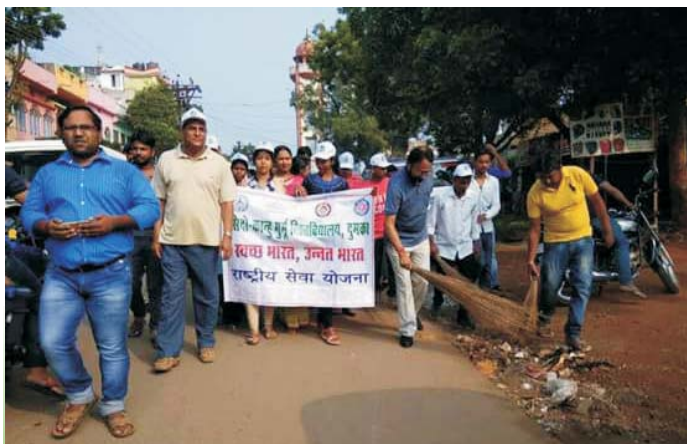
University fraternity involved in 'Swachhata hi Seva' campaign led by Hon'ble Vice Chancellor in the streets of Dumka

to make it a success. The team lead by the Vice-Chancellor comprised several important citizens of the town, visited the busiest places of the town. Students of the university organized and participated in quite a few street-plays on the theme of the importance of cleanliness to raise awareness among the people. Inspired by the Vice-Chancellor, the Principals of the various affiliated colleges have also taken similar initiative.