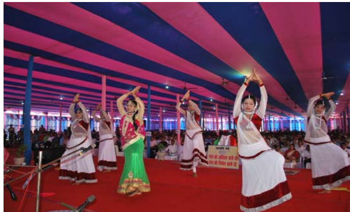
Students spreading the vision of 'Swachhata'

The Vice-Chancellor of SKM University and the faculty members also played a significant role in the second cleanliness drive which was focussed only on Dumka town, 'Chamakta Dumka, Damakta Dumka.' The Vice-Chancellor laid stress on how it was imperative to make this part of a daily habit and not an occasional one.