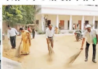
महिला कॉलेज में सफाई करती छात्रावर्ग, शिक्षक व कर्म।