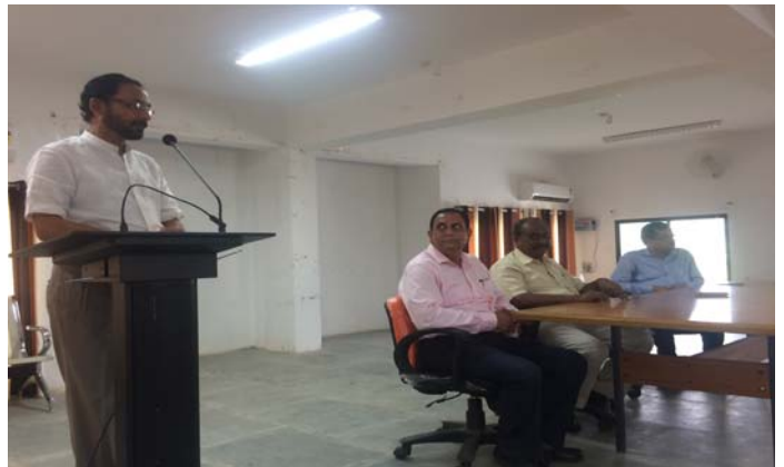
Address by Vice Chancellor in Symposium on Swami Vivekananda