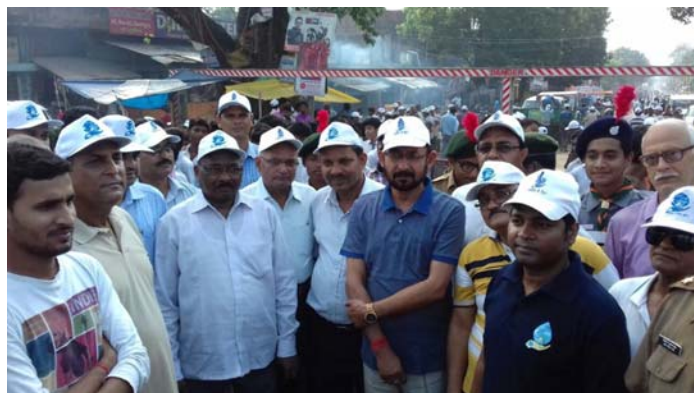
Vice Chancellor with DDC, SDM and University Officials on move to Clean Dumka

Narendra Modi, Prime Minister, 27 August, 2017.