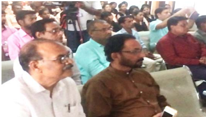
Hon'ble Vice Chancellor with Staff and Students listening to Prime Minister Sri Narendra Modi

In an open session held on 12 September a symposium and speech contest on the theme of Vivekananda's address was