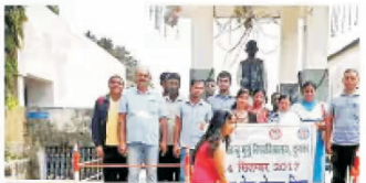
एसपी कॉलेज में सफाई करते एनएसएस के स्वयंसेवक।