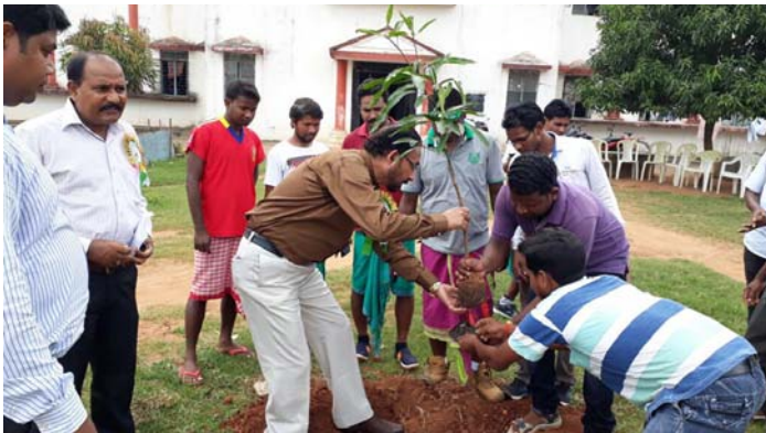
The usual practice of tree plantation, attempt of Greening the Campus

Vice Chancellor Prof MP Sinha believes that green has to be evergreen, meaning the environment is not just to be maintained but sustained in the long run. Accordingly, a drive to maintain a green campus is one of the major priorities of the University. With their ability to generate oxygen, and also hold the fragile top soil in place, trees possess a unique ability to control the daily damage done to environment. They provide the much-needed shade in a climate where the sun beats down mercilessly. In recent times, there have been several occasions when saplings