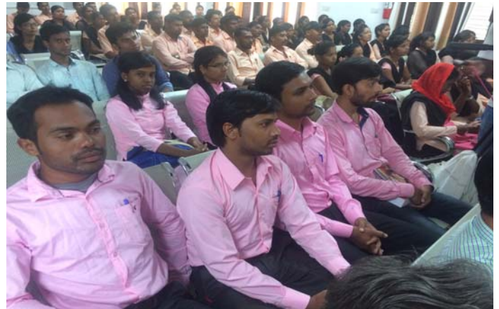
A view of audience in University Conference Hall listening to Prime Minister Sri Narendra Modi

affiliated colleges of SKMU. Students flocked in large numbers to the telecast and were reported to feel inspired by the Prime Minister's message.